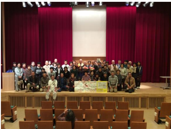
群馬公演終了後出演者スタッフ全員で