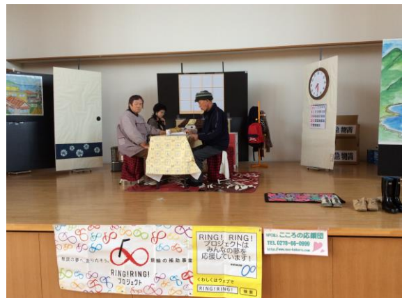
気仙沼市での公開練習光景