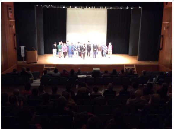
東京目黒区での公演光景